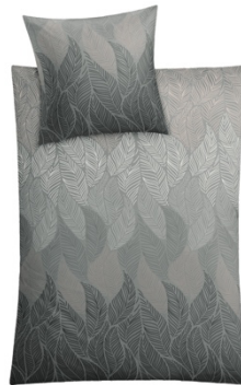
BETTWÄSCHE JAMIRO Grau, 100% Baumwolle, versch. Maße, ab 59,99 €