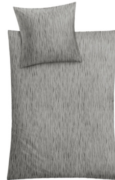
BETTWÄSCHE MINO Silbergrau, 100% Baumwolle, versch. Maße, ab 59,99 €

Die neuen Bettwäsche-Kollektionen von Kleine Wolke sind ab sofort auf www.klenewolke.com/bettwaesche/ sowie im Fachhandel und bei autorisierten Versand- und Onlinehändlern erhältlich.