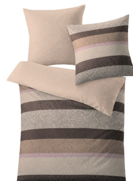
BETTWÄSCHE GWEN Nussbraun, 100% Baumwolle, versch. Maße, ab 59,99 €