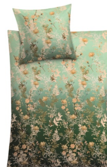
BETTWÄSCHE ZAHRA Pistaziengrün, 100% Baumwolle, versch. Maße, ab 69,99 €