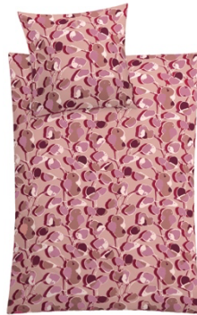
BETTWÄSCHE CATALONIA Rot, 100% Baumwolle, versch. Maße, ab 59,99 €