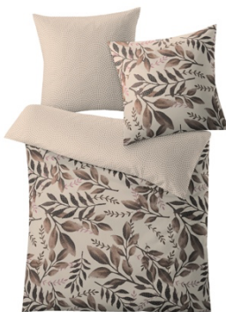
BETTWÄSCHE LIAN Taupe, 100% Baumwolle, versch. Maße, ab 59,99 €

Warme tiefe Brauntöne mit zarten Rosé-Akzenten sorgen für viel Geborgenheit. In Form von Blättern oder Streifen findet der Trend-Ton Braun seinen Weg ins Schlafzimmer.