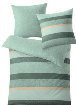
BETTWÄSCHE GWEN Salbeigrün, 100% Baumwolle, versch. Maße, ab 59,99 €

Das anmutende Dschungel-Gefühl mit einer großen Portion Frische sorgt für gute Stimmung im Schlafzimmer. Helle und dunkle Grün-Töne lassen die Blätterwelt leuchten.