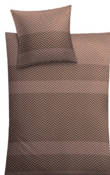
BETTWÄSCHE COSY Brazil, 100% Baumwolle, versch. Maße, ab 69,99 €