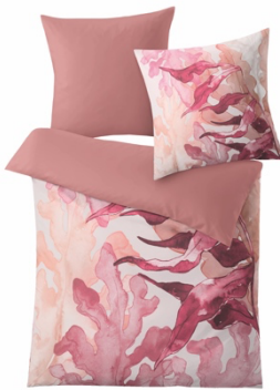
BETTWÄSCHE BLAZE Multicolor, 100% Baumwolle, versch. Maße, ab 79,99 €

Dank moderner und opulenter Designs wird der Schlafraum zum besonderen Hingucker. Eine reiche Palette verschiedener Rottöne verströmt Behaglichkeit und Eleganz.