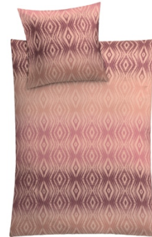
BETTWÄSCHE TEBAS Pastellrosa, 100% Baumwolle, versch. Maße, ab 59,99 €