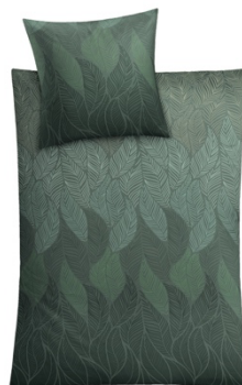
BETTWÄSCHE JAMIRO Tannengrün, 100% Baumwolle, versch. Maße, ab 59,99 €